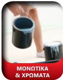
ΜΟΝΩΤΙΚΑ & ΧΡΩΜΑΤΑ