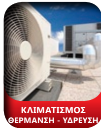
ΚΛΙΜΑΤΙΣΜΟΣ ΘΕΡΜΑΝΣΗ - ΥΔΡΕΥΣΗ