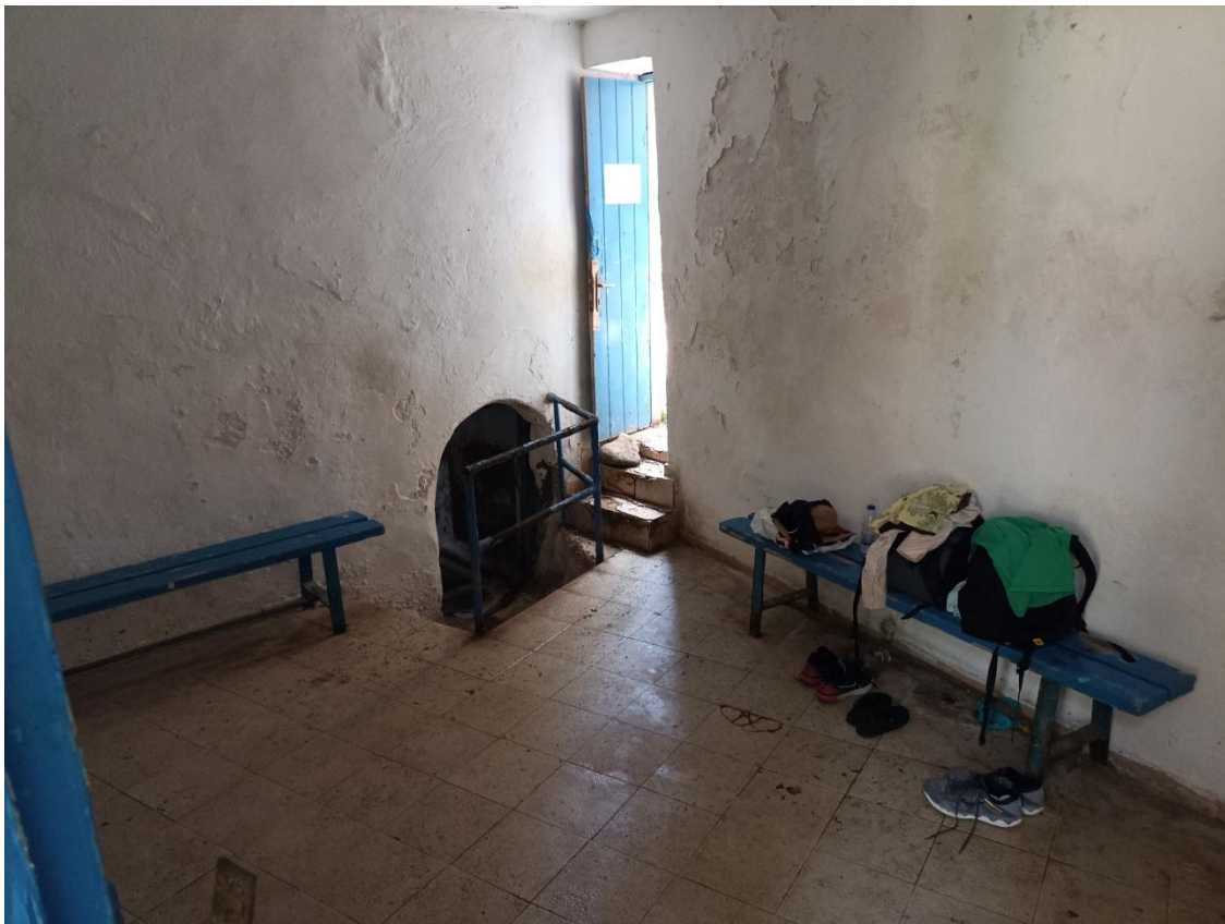
Ο προθάλαμος του οθωμανικού λουτρού