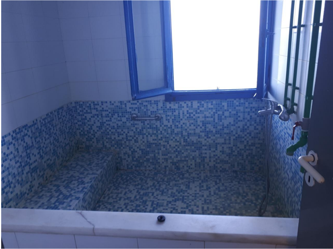
Ατομικό λουτρό ισογείου